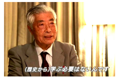
(歴史から)学ぶ必要はないんです

MBS ドキュメンタリー映像'17 教育と愛国 ~教科書でいま何が起きているのか