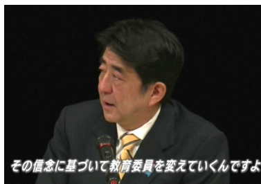
その信念に基づいて教育委員を変えていくんですよ

MBS ドキュメンタリー映像'17 教育と愛国 ~教科書でいま何が起きているのか