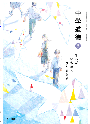
採択された光村図書の表紙(3年生)

委員は、「要望書に目を通した」「市民の意見書に、先生方の意見を大事にしてほしいとあり、これは、とても大事な視点だと思っている」「先生方(中学校長提出の調査書)や展示会での市民の意見書を参考にした」「始めに結論ありきのように、結論に導いていくのはふさわしくない」と発言。委員は市民の意見や学校現場の意向をくみ取りながら自らの意見を形成。また、考え議論する教科書が良いとしました。