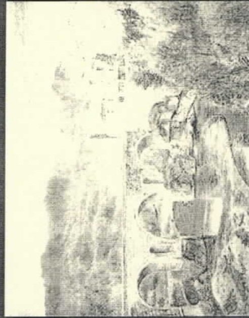
三浦 寛前治「リボア・アリアビエとポイント・ヘル」1985年 水彩・紙(茅ヶ崎市収蔵)